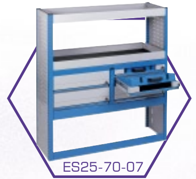
ES25-70-07 Polc egység fiókokkal, kivehető szerszámtárolóval*