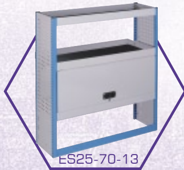
ES25-70-13 Polc egység felhajtható ajtóval*