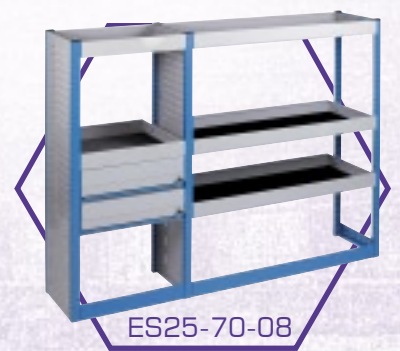
ES25-70-08 Polc egység fiókokkal (nyitott)**