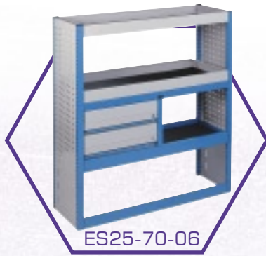
ES25-70-06 Polc egység fiókokkal*