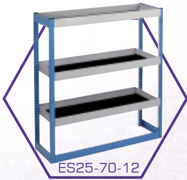
ES25-70-12 Polc egység*‡