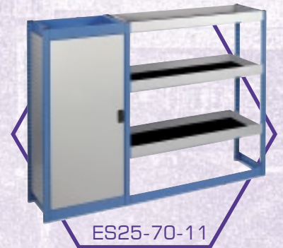
ES25-70-11 Polc egység szekrényel**